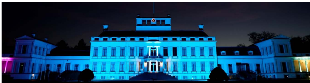
Paleis Soestdijk in de kleuren van Rare Disease Day